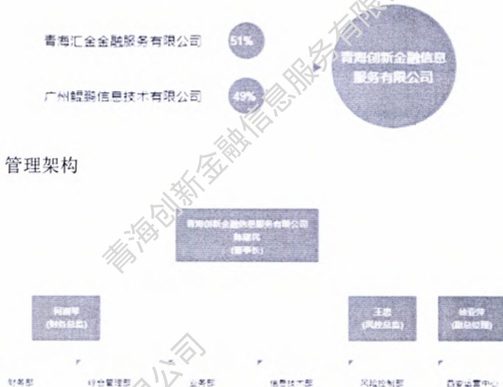
青海创新金融信息服务有限公司一股权架构图