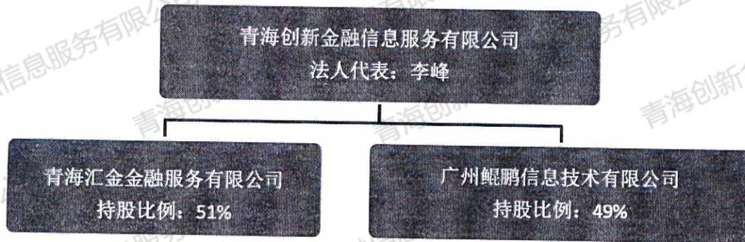
青海创新金融信息服务有限公司一股权架构图